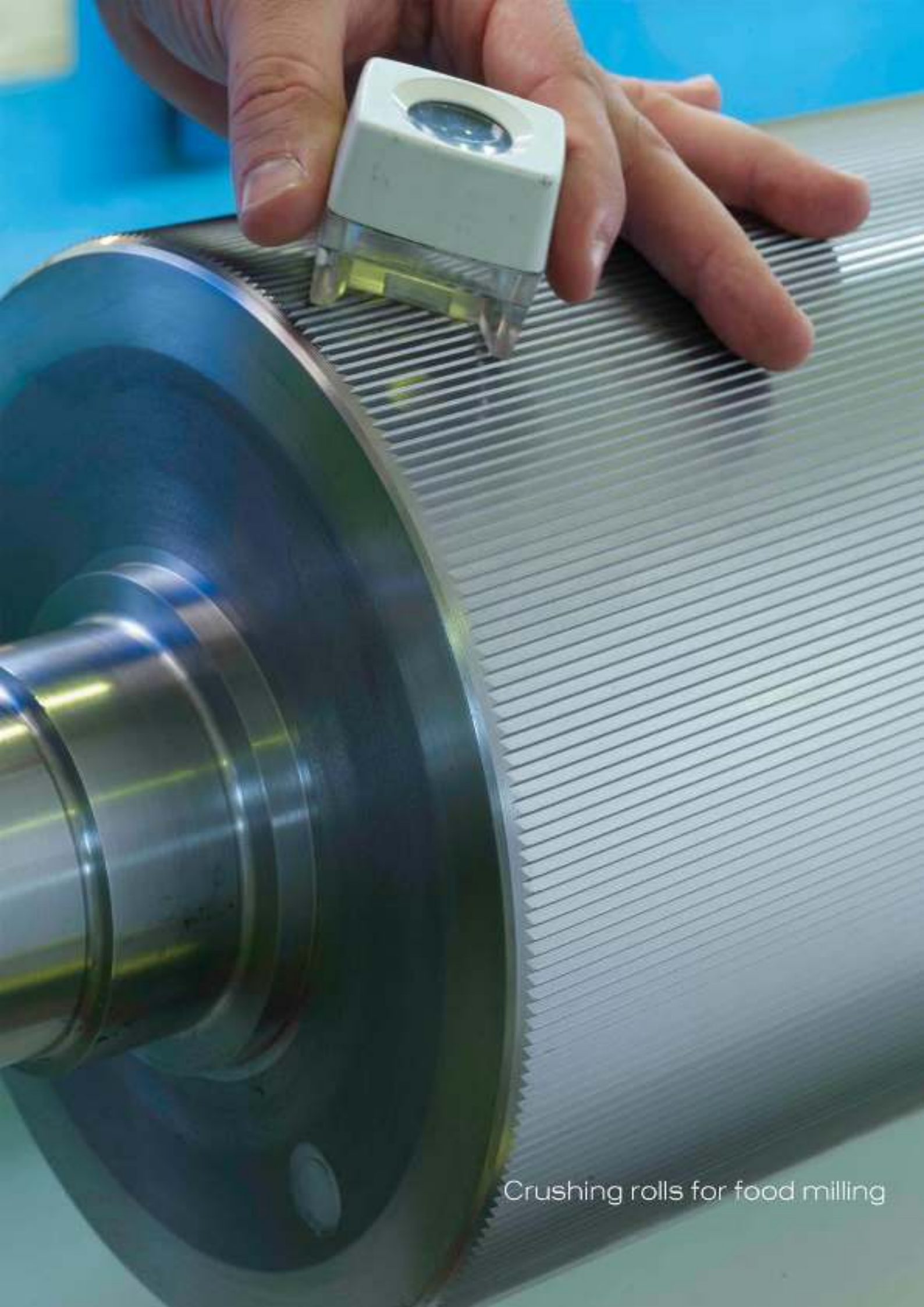
Crushing rolls for food milling